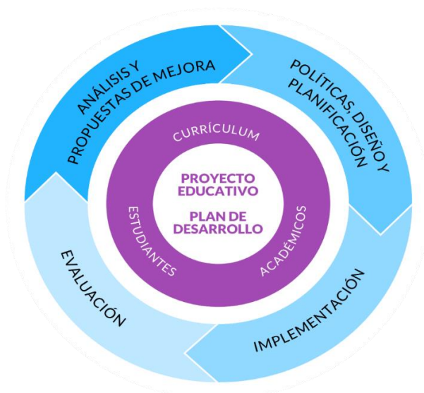
Figura 2: Sistema de Aseguramiento de la Calidad del postgrado.

Como se muestra en el diagrama siguiente (Figura 2), el sistema de aseguramiento de la calidad pone en su centro al Proyecto Educativo y Plan de Desarrollo Institucional (elaborados en consonancia con la Misión y Visión de la UDD), los que orientan el proceso de enseñanza-aprendizaje que involucra al currículum, estudiantes y académicos.