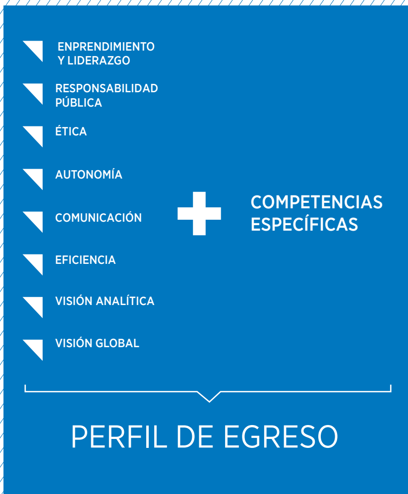
Figura 1: Componentes perfil de egreso UDD