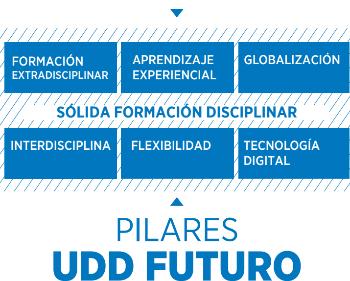
Figura 2: Características del Currículum UDD

El Proyecto Educativo UDD Futuro trae consigo una serie de lineamientos que persiguen enriquecer la oferta formativa del pregrado, diseñando planes de estudio más innovadores, integradores y flexibles.