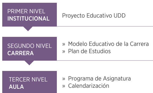
Figura 5: Niveles de implementación del Proyecto Educativo

Por lo tanto, la implementación del Proyecto Educativo UDD se visualiza de la siguiente manera: