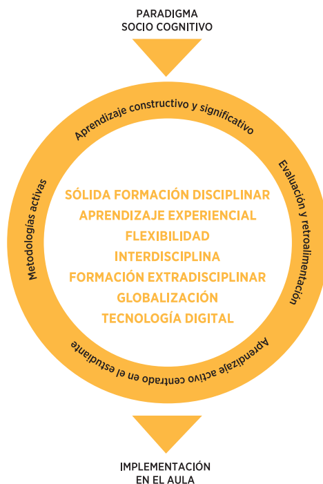
Figura 4: Características del currículum UDD y fundamentos del proceso formativo

De acuerdo a lo anterior, la definición de metodologías y estrategias de enseñanza tiene un rol fundamental en el proceso formativo, pues éstas se transforman en el puente a través del cual el conocimiento es construido por el estudiante y mediado por el docente. Por tanto, la forma en la cual se genere este aprendizaje va a influir positiva o negativamente en el logro de las metas de cada asignatura. En este escenario, tanto el paradigma sociocognitivo, como el aprendizaje activo y significativo, promueven la incorporación de variadas estrategias de enseñanza, como, por ejemplo: